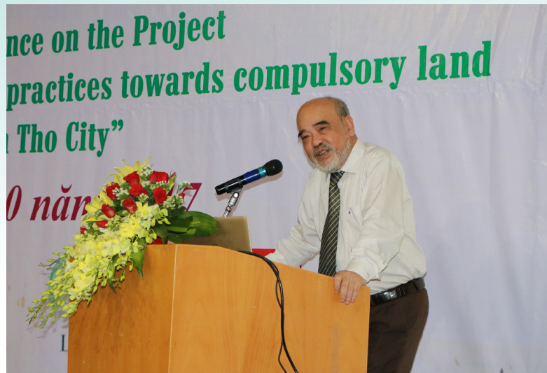
Đại biểu trình bày tham luận tại Hội thảo.

hỗ trợ chính quyền địa phương trong việc soạn thảo dự thảo sửa đổi các quy định nhằm thực hiện hiệu quả hơn, phục vụ tốt hơn cho người dân địa phương, đồng thời, hỗ trợ nâng cao nhận thức của người dân và năng lực của công chức, viên chức địa phương về các quy định của pháp luật liên quan đến quy trình thu hồi đất, bồi thường, hỗ trợ, tái định cư để pháp luật được tuân thủ tốt hơn ở địa phương, đạt hiệu quả thu hồi đất, góp phần phát triển kinh tế xã hội ở địa phương và cải thiện đời sống của người dân.