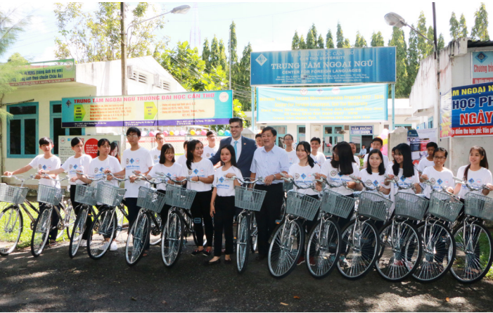
Mỗi em được tặng một chiếc xe đạp khi tham gia chương trình.

Chương trình Access được khởi động từ năm 2004 và đã có hơn 110.000 học sinh từ hơn 80 quốc gia được thụ hưởng lợi ích từ chương trình. Tại Việt Nam, đã có khoảng 1.000 học sinh tham gia chương trình này. Đây là khóa thứ hai chương trình được tổ chức tại Cần Thơ cho đối tượng các em học sinh nghèo, cận nghèo, có hoàn cảnh khó khăn trên địa bàn thành phố. Tham gia chương trình Access, các em học sinh có thể phát triển kỹ năng tiếng Anh để có được việc làm hoặc việc học tập tốt hơn trong tương lai. Bên cạnh đó, các em còn được học về văn hóa và xã hội Mỹ cũng như các kỹ năng vi tính hữu ích khác. Sau hai năm tham gia chương trình, các em tự tin hơn và có thể giao tiếp bằng