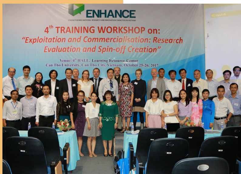
Ảnh lưu niệm tại Hội thảo.

Thông qua Hội thảo và Tọa đàm, các đại biểu trong và ngoài nước có dịp trao đổi ý kiến với mục tiêu nhằm tăng cường khả năng nghiên cứu khoa học, chuyển giao công nghệ gắn kết với doanh nghiệp và tạo tiền đề cho ý tưởng khởi nghiệp cho sinh viên tốt nghiệp.