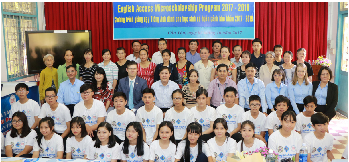
Ảnh lưu niệm.

mong muốn quý phụ huynh luôn ủng hộ, hỗ trợ để các em học sinh học tập hết sức mình, đạt được mục tiêu nâng cao trình độ tiếng Anh, đáp ứng yêu cầu về ngoại ngữ hiện nay.