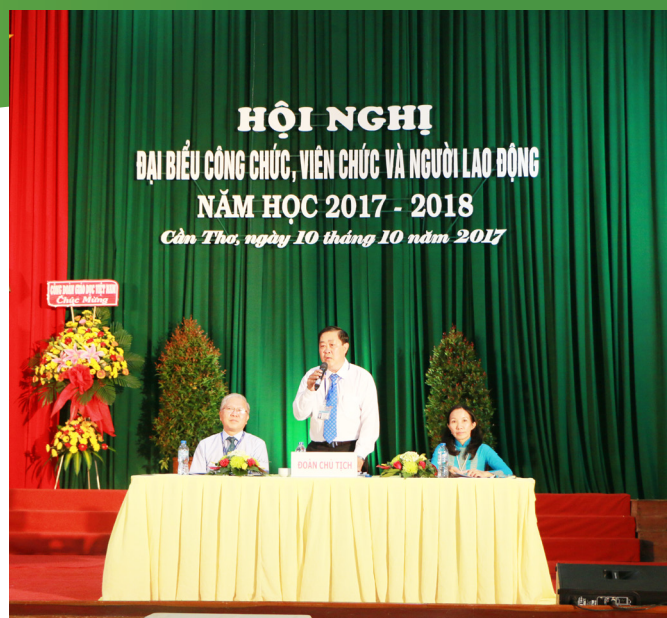
Đoàn Chủ tịch giải đáp ý kiến của đại biểu.