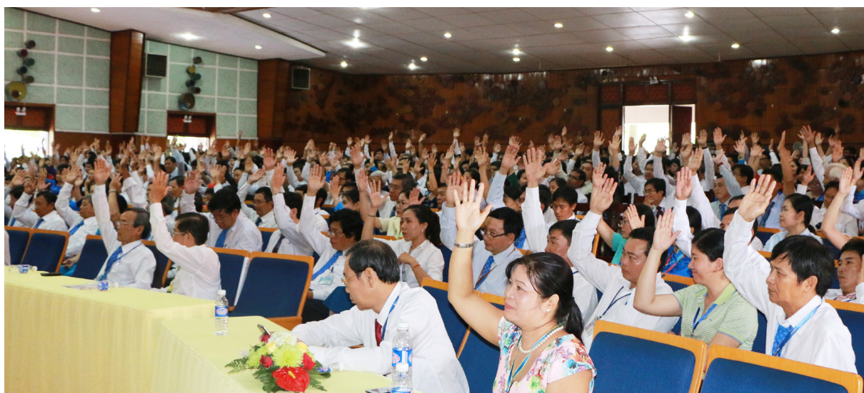
Hội nghị kết thúc thành công tốt đẹp sau biểu quyết tán thành Nghị quyết của đại biểu.

qua, và tin tưởng đội ngũ nhà giáo, người lao động của Trường ĐHCT, các đơn vị trực thuộc Trường thực hiện thắng lợi nhiệm vụ năm học mới 2017-2018.